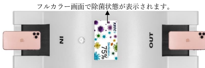
▲ 上から見た「CLEAN BUNKER」